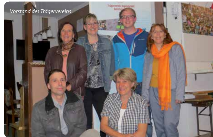
Vorstand des Trägervereins