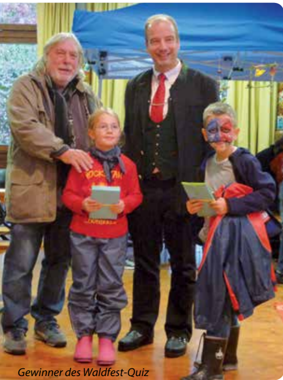
Gewinner des Waldfest-Quiz