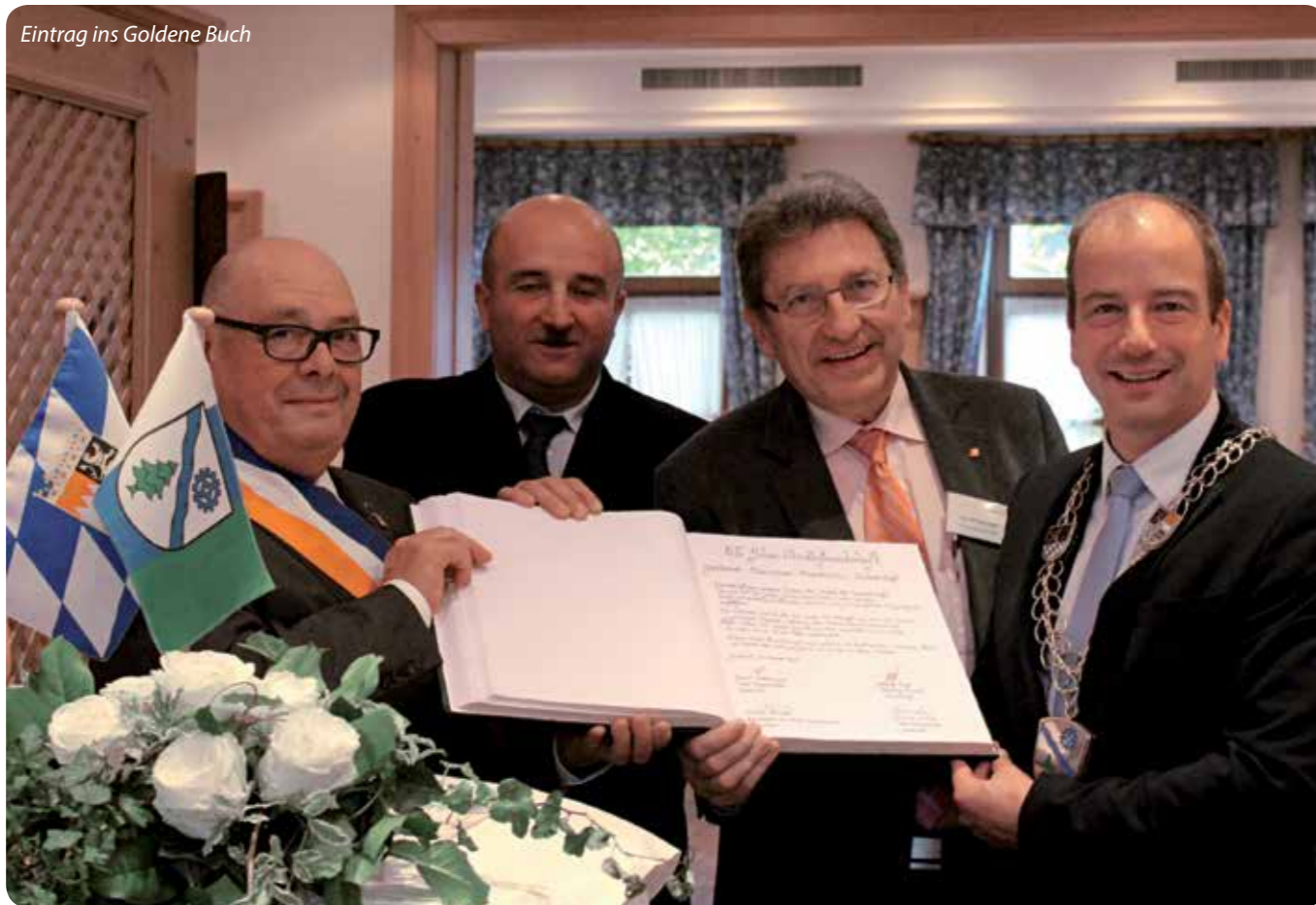
Eintrag ins Goldene Buch

Das 25. Jubiläum der Partner- und Freundschaftsstädte Geretsried, Pustavám, Nickelsdorf und Chamalières wurde an einem wunderschönen Wochenende, vom 9. bis 11. Oktober in Geretsried gebührend zelebriert.